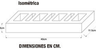
DIMENSIONES EN CM.